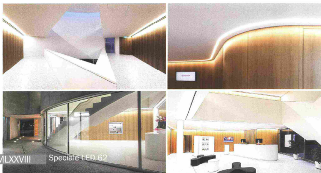
MMLXXVIII Speciale LED 62

cessa, mentre i percorsi delle rampe esterne sono illuminate da prodotti della linea Button - Button 200 DO per la rampa pedonale e Button 200 W a parete per quella destinata al passaggio delle automobili - ideali per creare percorsi luminosi anche negli ambienti dal design più insolito. Per illuminare il giardino che decora l'esterno dell'edificio sono stati utilizzati apparecchi da incasso a pavimento della linea Merope, dimmerabili e orientabili. La tecnologia avanzata a LED dona alla Banca Raiffeisen un'illuminazione in grado di seguire il design originale e le forme curve della struttura, valorizzando il carattere futuristico e innovativo.