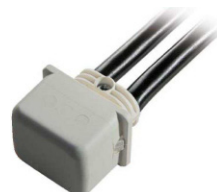
Giunto al gel IP68 IP68 junction box

For outdoor installations or for installations in damp places always use IP68 junction boxes in order to avoid the moisture to reach the luminaire through the power supply cable.